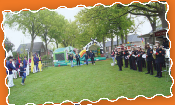
Ontvangst op De Woerd