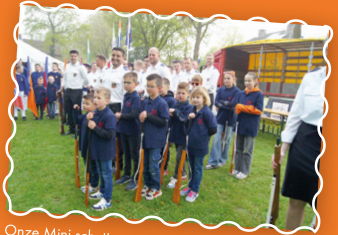
Onze Mini schutters netjes in het gelid