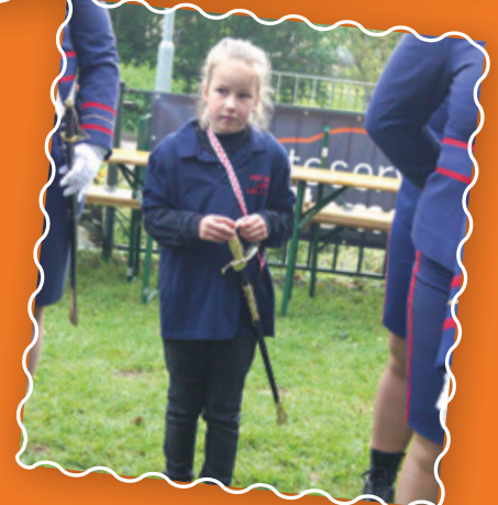
De allerjongste sabella